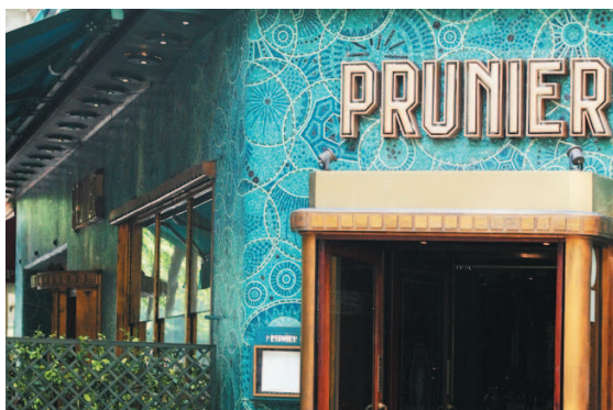
La façade de la Maison Prunier