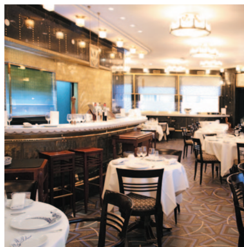
La salle de la Maison Prunier