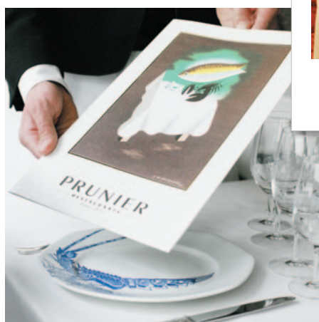
La carte Prunier